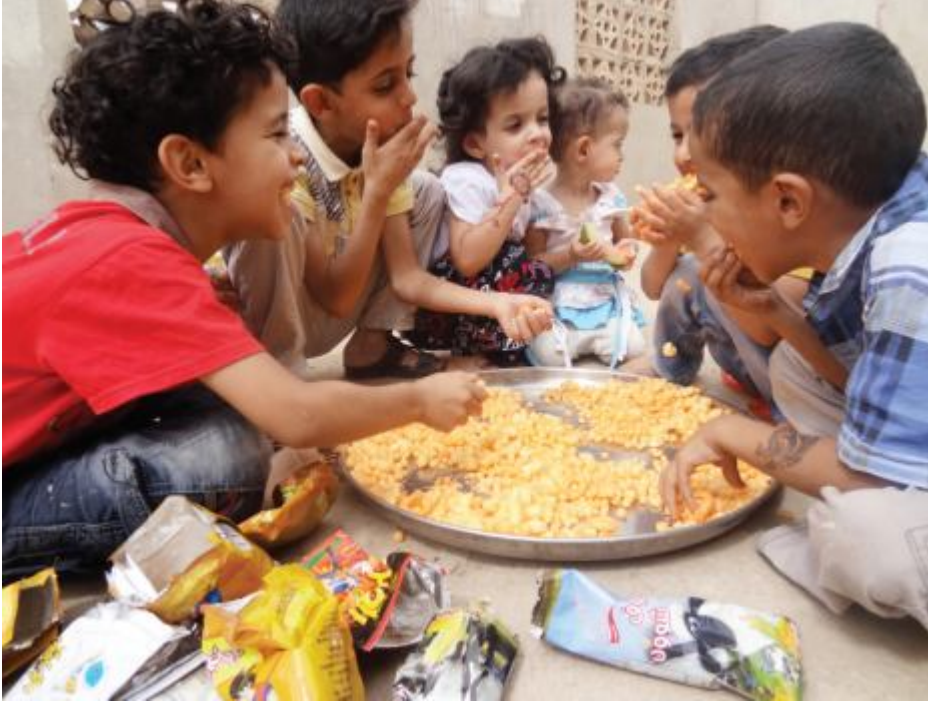
خفيف على الجيب. تقبل على صحة الأطفال

خلال فترة قصيرة شهد اليمن نمواً كبيراً في صناعة «البفك» المنتج الذي تمكن من غزو الأسواق المحلية بسرعة كبيرة مكوناً مساحة واسعة من المستهلكين خلال سنوات قليلة. لكن الأمر تغير مؤخراً كما يبدو حين أصدر مكتب التجارة والصناعة بأمانة العاصمة تقريراً مفاده أن مصنعي هذا النوع من المنتجات يهتمون بالربح السريع أكثر من اهتمامهم بالجودة والمواصفات..