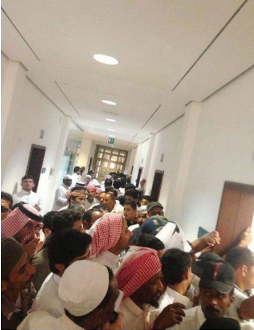
مغتربون في السفارة، يبحثون عن كرامة وطن