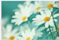
النسرين الأصفر تراجع العاطفة