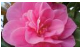
قرنفل 1000 _ 2000