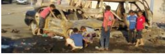
أطفال في عدن يلعبون بالخرقة ..

للأطفال في عدن كما في غيرها من المحافظات اليمنية طقوسهم خلال الشهر الكريم حيث يتجمع عدد منهم بشكل طاوور في أحياء منازلهم، ويأخذون علباً فارغة من علب الفاصوليا أو الصلصة اثنتين لكل واحد منهم ويضربونها ببعضها وهم يتشدون «مرحب مرحب يا رمضان .. شهر التوبة وشهر الصيام».