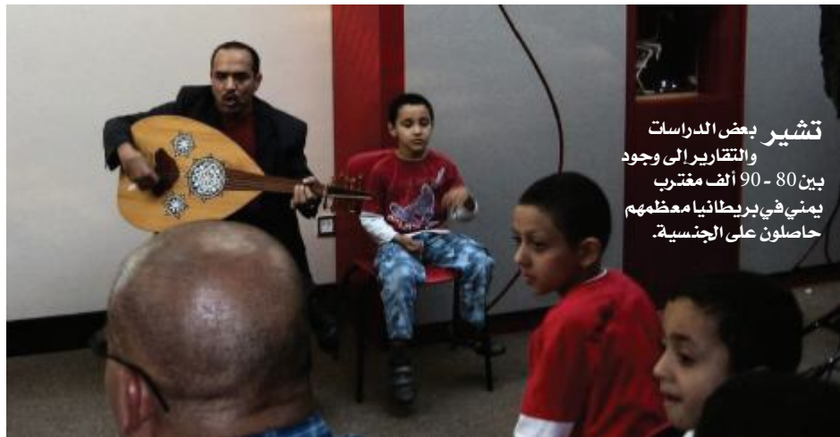
يوم ثقافي يمني في شيفيلد

تشير بعض الدراسات والتقارير إلى وجود بين 80 - 90 ألف مغترب يمني في بريطانيا معظمهم حاصلون على الجنسية.