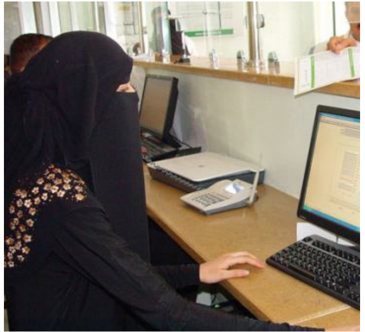
خدمة النساء - زاوية غير مرئية في سياسة المصارف

في القسم الوحيد للسيدات في بنك اليمن والكويت للتجارة والاستثمار، تقدم 3 موظفات فقط خدمات مصرفية لحوالي 3000 عميلة يشكلن ما نسبته 10% من إجمالي العملاء بحسب احصائيات البنك .