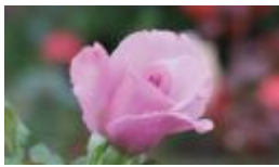
روز 3000 _ 5000