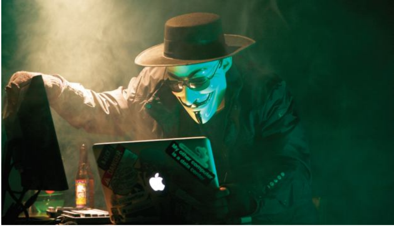
● لصوص عن بعد...

اقتحام الحياة الخاصة بقصد التشهير بالآخرين وإلحاق الضرر بهم عبر وسائل تقنيات المعلومات المختلفة.