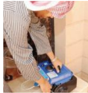
الماطور.. أحد أفراد الأسرة في اليمن

ثمة أنواع أخرى من الحلويات منزلية التحضير في عدن منها الجميلي والكرم كراميل وبسكويت ماري والفرت المشكل والقشطة وكريمة الدريم ويب، حيث تعدهم نجة و تضعهم بشكل طبقات في الثلاجة،