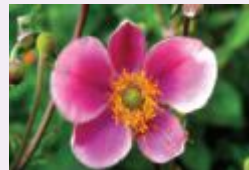
شقائق النعمان الترقع