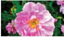
جبريل 100 _ 400