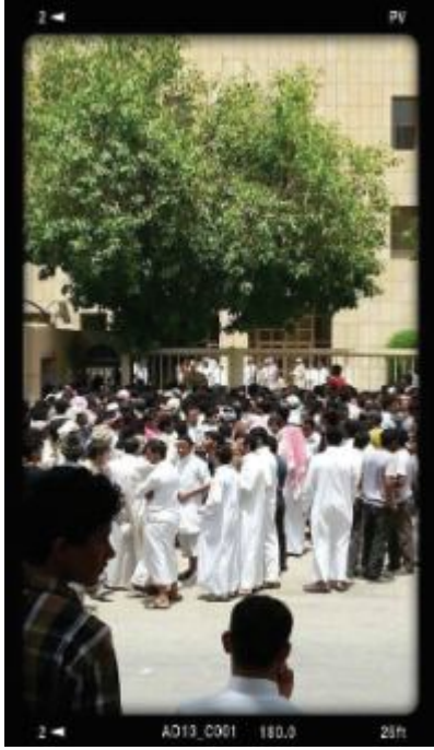
التجمهر والزحام كعادة لازمة.. يمنيون يتظاهرون أمام السفارة اليمنية بالرياض.

صادمة لآلاف الضحايا الذين وقعوا خلال الأشهر الماضية أو مئات الآلاف الذين تتهددهم الإجراءات المعلنة، مهما تعززت القناعات بشأن حق المملكة في ترتيب سوق عملها وتصحيح وضع عمالة أجنبية على أراضيها تقدر بـ 9 ملايين، أي 50% من حجم سكان البلاد.