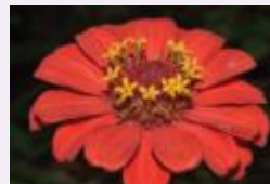
الزينيا التفكير بالأصدقاء الغائبين