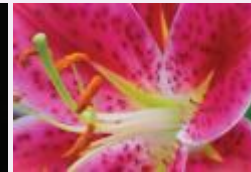
رجل القراب الطفولة