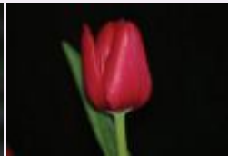
التوليب الأحمر اعتراف