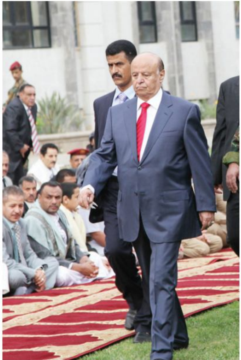
يرقبون تحركاته بصمت، تريد رئيساً قوياً بالشعب لا قوياً عليه