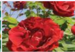
القرنفل الأحمر الغامق انكسار.