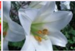
زهرة الهولي الأبيض شعور بالنسيان؟