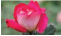
روز 150 _ 300