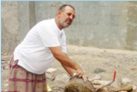
المخلفات .. غاز لا يخضع للتقطع والازمات