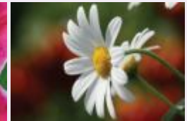
الأفدوان الأبيض البراءة