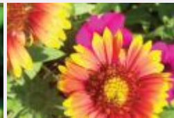
القرنفل الأصفر الندم