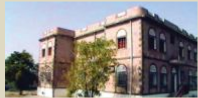
منزل الرئيس هادي في محافظة أبين