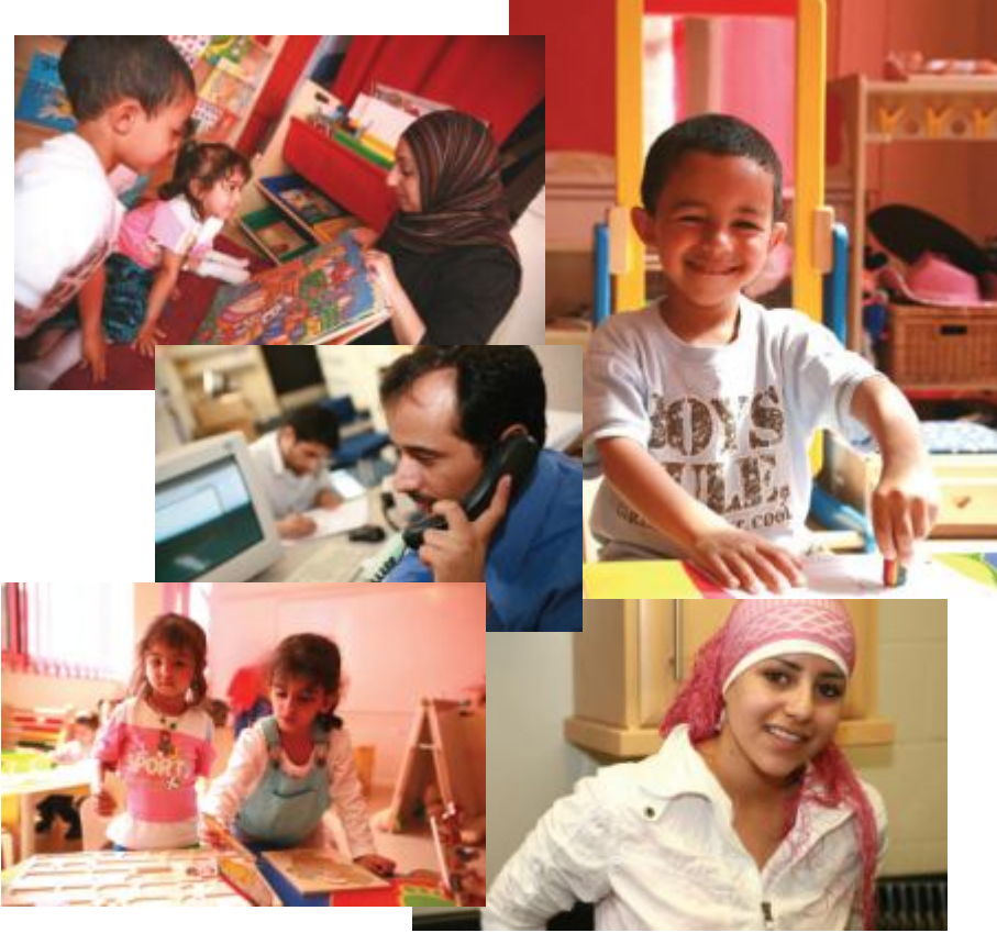
• يمنيون في معهد هدا فيلدا في مدينة شيفيلد

غذائية وأدوات ومستلزمات يمنية بشكل لافت وكأنك في أحد المحلات التجارية بمحافظة إب .