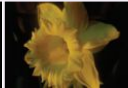
النرجس الكبير نبل وشهامة