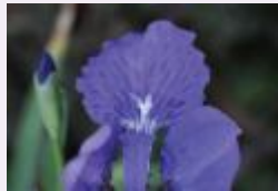
البنفسج الأزرق وفاء