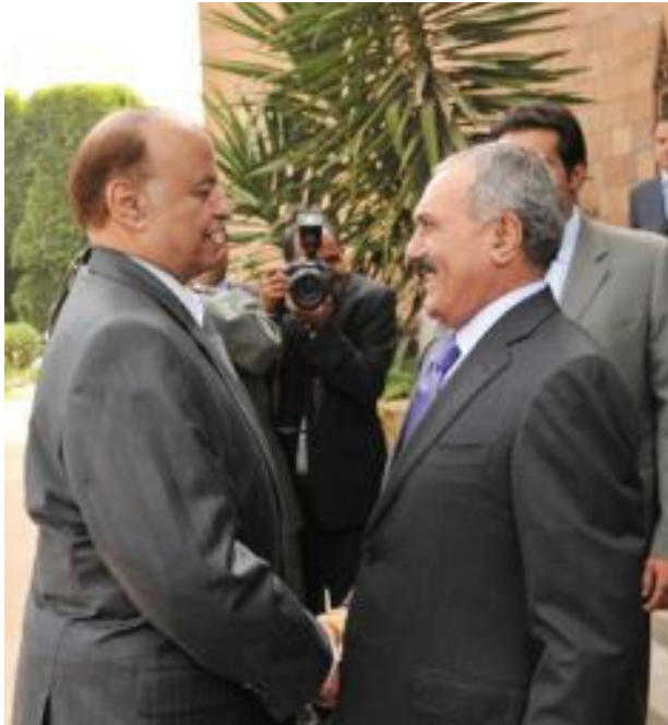
من نظرة الجسد. يبدهادي في موقع السيطرة

تحققه المعارضة يحصل أركان النظام السابق على ميزة إضافية تعزز حصانتهم من فوبيا التوجه إلى ساحة العدالة .