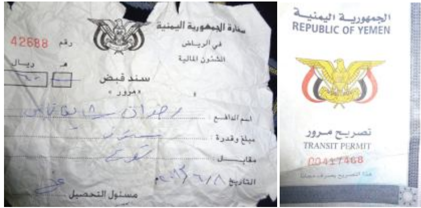
تصريح مرور مجاني يتجرعها المغترب بـ60 ريال سعودي

الحجم التقديري للتستر التجاري بالمملكة يبلغ 236,5 مليار ريال سعودي، وذكرت ورقة مقدمة للندوة أن 30% من العمالة الأجنبية النظامية تعمل لحسابها الخاص تحت ظاهرة التستر. وأشارت الورقة إلى أن إجمالي تحويلات العمالة الوافدة بين عامي 2002 - 2012 بلغت 635,7 مليار ريال سعودي!! وهو ما اعتبرته الورقة «تسرباً للاقتصاد السعودي يصل إلى نحو 10% من الناتج المحلي» فيما يسيطر العمال الأجانب «على تجارة الجملة والتجزئة في قطاع الملابس والأقمشة بنسبة 97,5% من إجمالي عدد العمالة بالسوق»، ويأتي اليمنيون في المقدمة إن لم يكونوا أغلبية هذا القطاع خاصة.