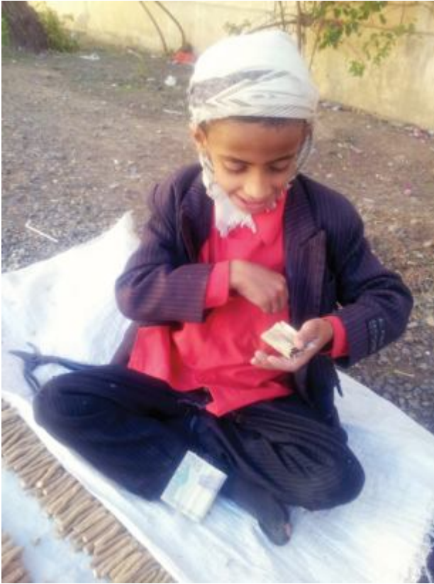
عين على المال... عين على المستقبل

لأول مرة، ولا يفقهون ما «الإعلام الاقتصادي». هم يفهمون فقط كسرة خبز، وحزمة ريالات يعودون بها آخر النهار ليسدوا بها رمقهم.