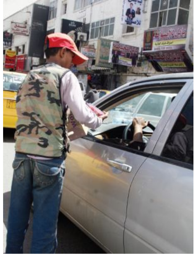
ألوان الكفاح ترتدي أحلامهم