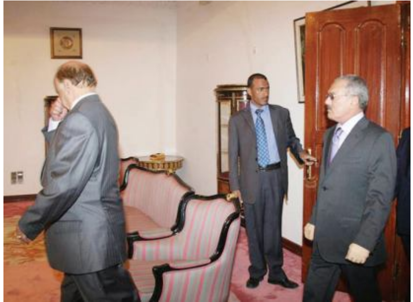
إعلامي يقبّل حضوراً للرئيس

في الوقت الذي يسعى فيه صالح لتكريس نفسه إعلامياً حتى بعد مغادرته السلطة خشية التواري خلف الأضواء والدخول في زاوية النسيان، تبدو الآلة الإعلامية للرئيس هادي ضعيفة للغاية. بهذه الصورة ربما يمكن وصف السياسة الإعلامية