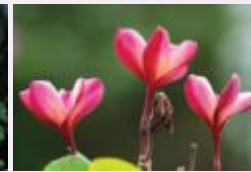
الياسمين الهندي حب