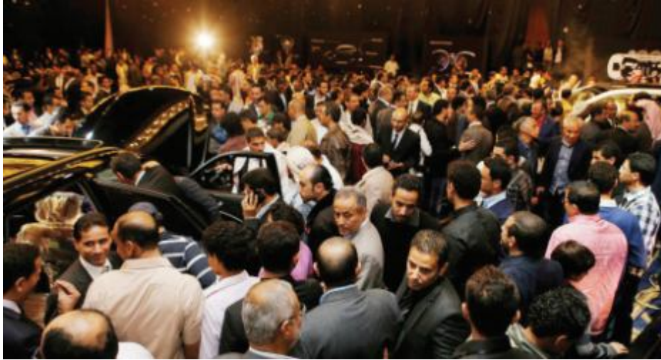
جانب من أحد مهرجانات تشدين موديلات هيونداي في اليمن

لم يعد بالإمكان اليوم الحديث عن القطاع الخاص بعيدا عن الحضور الإعلامي، بل والاستثمار في الإعلام أيضا.. في اليمن يظهر الأمر مختلفا حد الغرابة، حيث ما يزال إعلام المؤسسات الخاصة من وجهة نظر صحفيين غير قادر على مجرد التفاعل مع الإعلام.