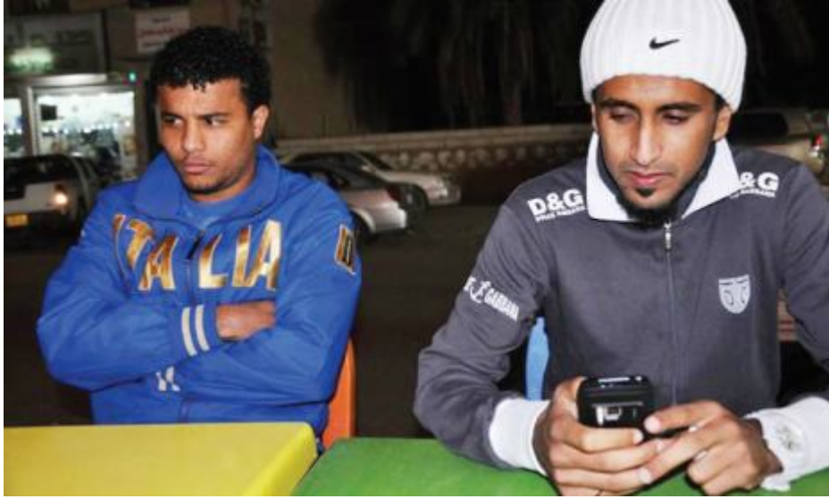
الرياضيون.. منفيون في الوطن