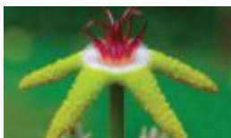
جبريل 3000 _ 8000

صاحب محل «أزهار فالنتاين» بالعاصمة صنعاء .