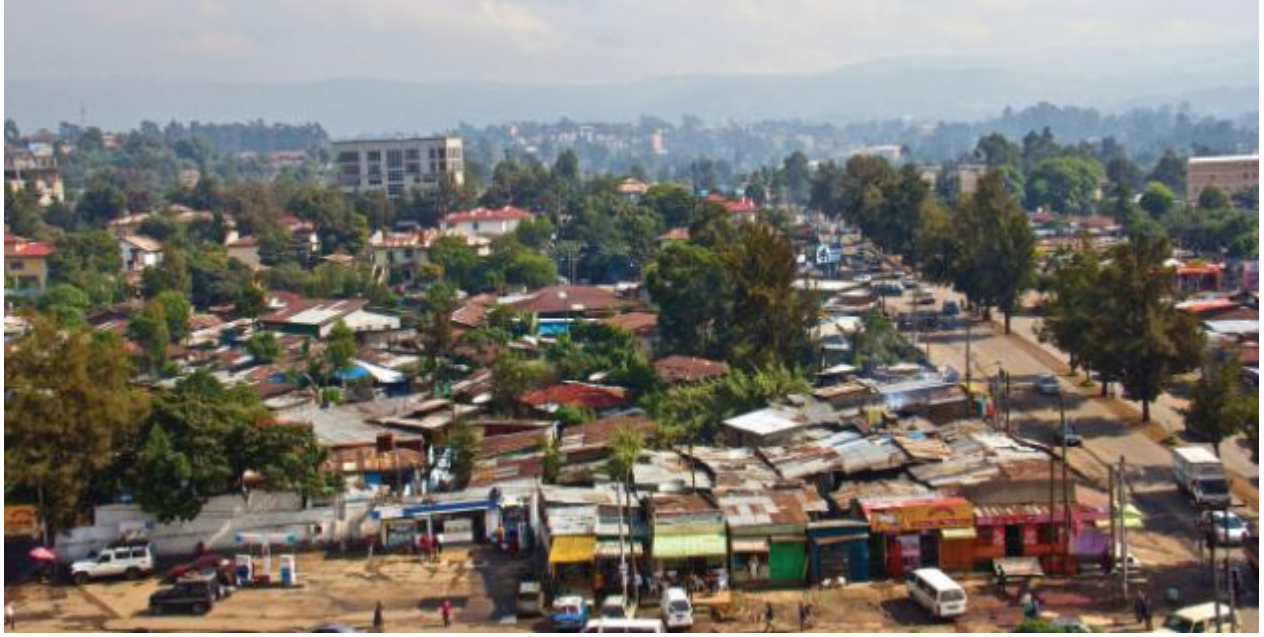
أديس.. مدينة التعايش والسلام

الجديدة» مدينة حديثة ، تقع على ارتفاع 2400 متر عن سطح البحر، وتتمتع بجو يعد من أجمل الأجواء في العالم إذ لا ترتفع درجة الحرارة في الصيف عن 27 درجة مئوية ولا تنخفض في الشتاء عن 7 درجات .. المدينة تحيط بها التلال من جميع جهاتها، وقد بنيت وفقا للاعتقاد الإثيوبي القديم الذي كان