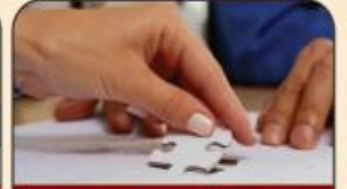
خدمة القرض الحسن