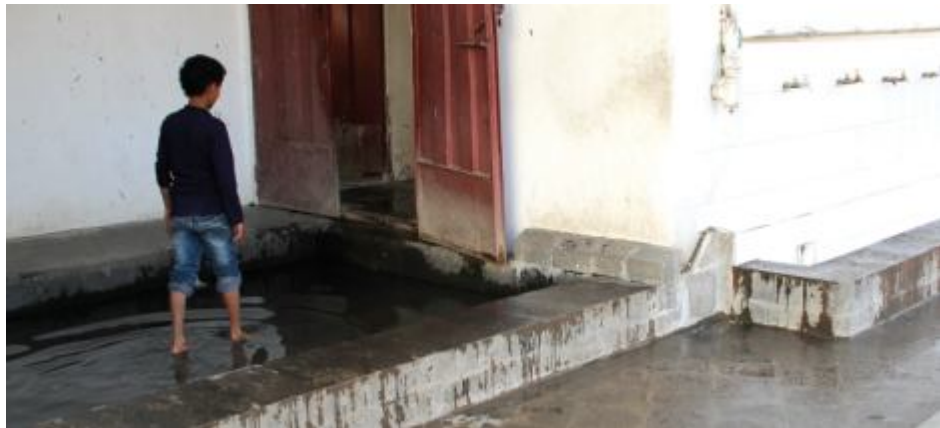
مع كل خطوة ثمة احتمال للإصابة بالمرض