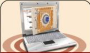
خدمة الإنترنت المصرفي