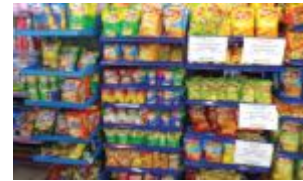
تخفيضات ولكن.. اللهم إني صائم

فيها على المواطن المسكين يعني يدوله كاسة او لعبة سعرها ريالات محدودة مقابل شراء سلعة مشاركة على الانتهاء طبعاً سلع معينة أكيد . من جانب آخر تقدم الشركات الكبيرة عروضاً كبيرة لمعارض السوبر ماركت الضخمة تصل الى تخفيض بمقدار 25% الأمر الذي يؤثر على أصحاب المحلات الصغيرة والمتوسطة بحسب شادي لجهة أن الشركات تنافس المحلات في بيع بضائعها وتقدم الجوائز وبعض الأشياء المجانية لمن يتسوق من معارضها بشكل أوسع فتحد بذلك من سوق محلات