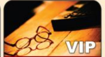
خدمة كبار العملاء