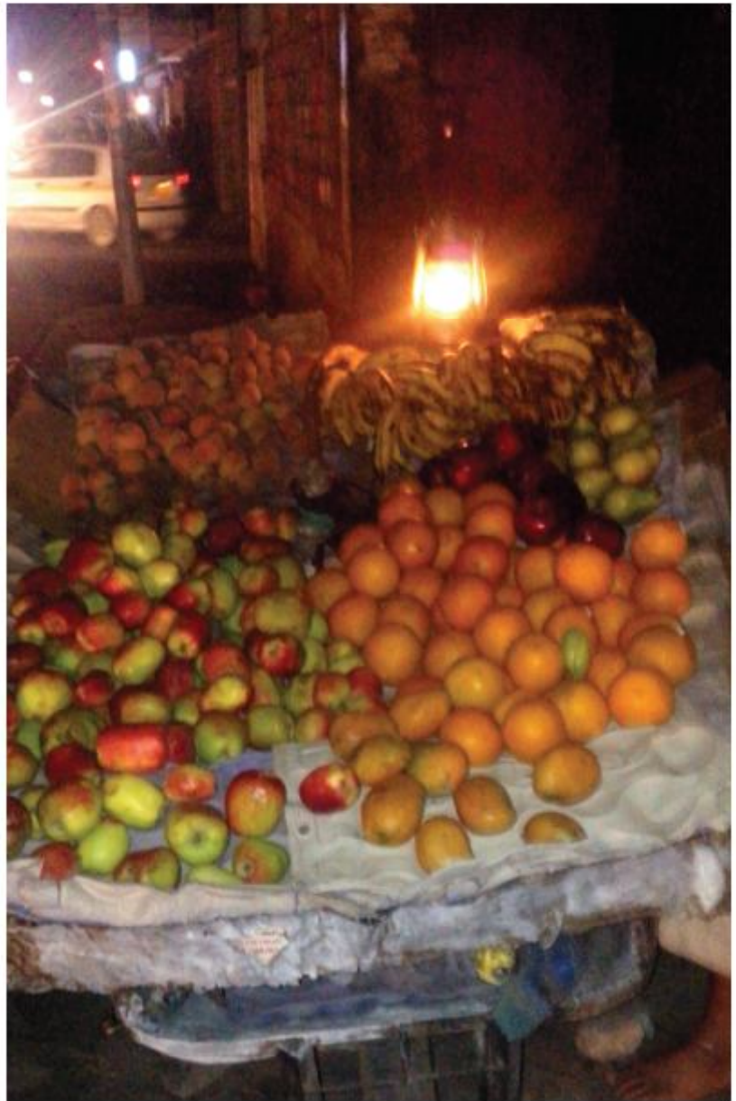
في الظلام تدور أشياء كثيرة لا يعلمها العامة المتشغلين بالبحث عن لقمة العيش