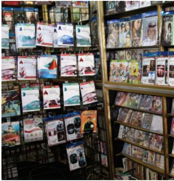
الكاسيت.. من شلف الجال إلى رشيف الذاكرة

الصغيرة الخاصة بالجوال وأجهزة الـ MP3 توقف رواج الشريط الذي بات يطلق عليه بـ«الشعبي» أدى إلى توقف شركات إنتاج صوتية عن العمل أيضاً حيث ظلت تعتمد على تقنية شريط التسجيل ولم تعتمد على تحديث أدواتها ومواكبة جديد العصر.