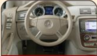
خدمة قرض سيارتي