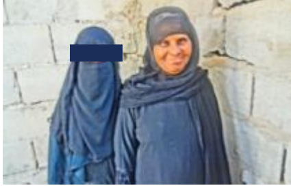
الهبية (السجانة) توفيت والمجلة ماثلة لطباعة