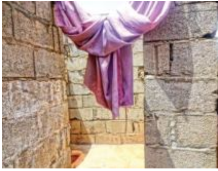
جانب من أروقة «السجن»