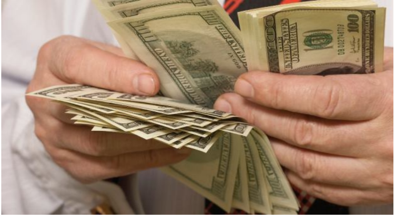
شركات الصرافة.. المال حيث أنت

من أكبر وأبرز الشركات المتخصصة في الصرافة والمراسلات المالية كعينة «للمسح» لتقييم الأداء الإعلامي والترويجي لشركات الصرافة والتحويلات المالية في اليمن ومدى