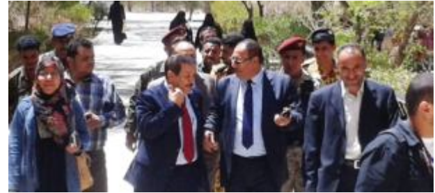
الوزير ورئيس الجامعة.. نمو في عدد الطلاب تراجع في الخدمات