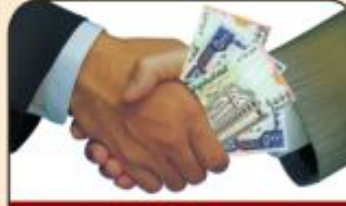
خدمة صرف المرتبات