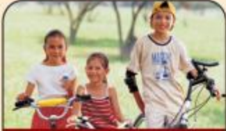
التأمين على حياة المقترض