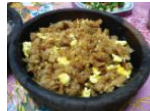
ليست وليمة أنها وجبة أسرية .. لكن في رمضان!