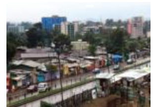
جانب من أحياء وأسواق المدينة