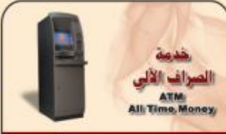
خدمة الصراف الآلي