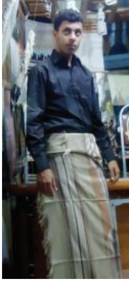
المعوز.. بعض ملامح الهوية اليمنية