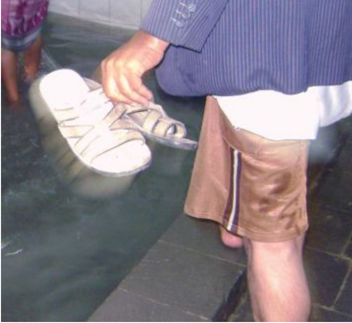
أحواض الجوامع.. لصتقاد قديم وأمراض حديثة

العصيمي القريب من منزله بحي «سبأ» الذي تؤمه أغلبية سلفية: «لا أحد يهتم بهذه الأمور (يقصد النظافة) نحن أمام رب العالمين، ولن يصيبنا إلا ما كتبه لنا».