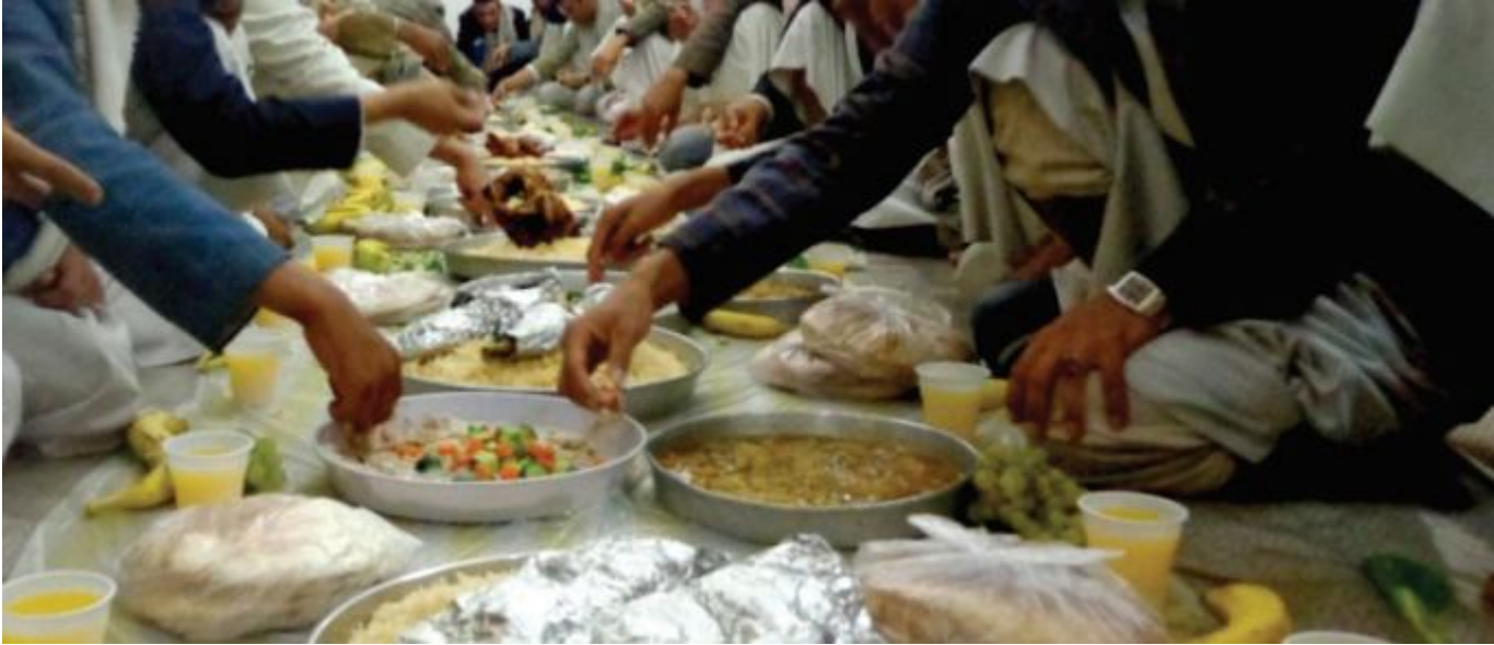
في رمضان .تحلوا الوجبة كلما زاد عدد المستضافين حول المائدة

لم يعد شهر رمضان مساحة للمراجعة والشعور بجوع الفقير وضائقته المعيشية بقدر ما صار كما يبدو شهراً للتباهي والتخمة حد المرض..