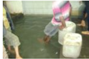
دخول في الخطر

نتائج الفحوصات التي أجريت لتوثيق هذا التحقيق الاستقصائي الذي استغرق إصداره 3 أشهر، ألبنت وجود تلوث برازي (غائطي) في جميع أحواض المساجد العشرة المشمولة بالتحليل «الميكروبولوجي»، وذلك بظهور مجموعة البكتيريا القولونية، وما يسمى «إشرشيا كولاي E-coli» الدالة على وجود تلوث برازي بشري، فضلاً عن احتمال وجود