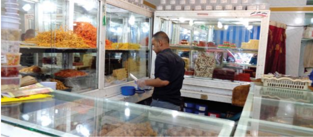
الحلويات . أول البنود في ذاكرة الصائم بعد العصر

في المسافة بين الـ 11 ظهراً وحتى الـ 3 صباحاً تظل محلات العدني لبيع الحلويات مثرعة الأبواب في استقبال الزبائن.. لكنها مع ذلك لا تستطيع تغطية الطلبات الكثيرة خلال أيام الشهر الكريم..