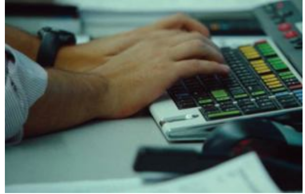
مفاتيح تقهر المسافة

كما اتضح أيضاً من خلال نتائج الاستبيان أن تصميم معظم الإعلانات والشعار بنسبة 80% تم محلياً إما عن طريق أفراد مزاولين للمهنة او شركات متخصصة في أعمال الدعاية والإعلان، بينما 10% تم في مدينة دبي، وكذا نسبة 10% داخلي