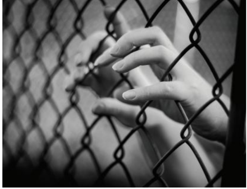
ابواب ونوافذ مفتوحة كاحتمالات الخطر والوجع

فقبل أن يصدر بحقها حكم قضائي، تودع المرأة المتهمة في غرفة في أحد البيوت، وتنتهي حياتها الطبيعية سواء خرجت من السجن أو بقيت فيه، وسواء برأتها المحكمة أو لم تبرئها، إذ يبدأ المجتمع بمعاقتها وسجنها داخل تهمتها بوصفها مذبذبة، وهو ما يجعل العالم يضيّق