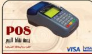
خدمة نقاط البيع