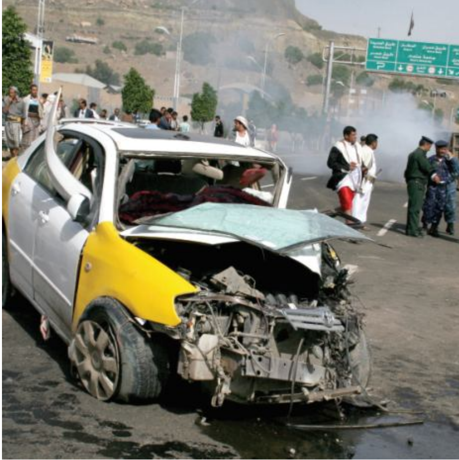
إذا رأيت هذا المشهد بعد العصر في رمضان فاعلم أنك في اليمن

حادث مروع بين سيارة اجرة وسيارة ماء(وايت) في جولة الرويشان ادى الى اضرار بالغة في السيارات واصابات بليغة في الافراد وحرمت السرعة الزائدة .