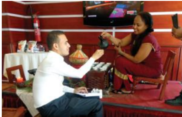
البحار يمني.. والقهوة اثيوبية

زجيتو «الملكة بالامهرية» تجسيد حي وواضح للتعايش بين الأديان المختلفة.. تعتنق الديانة المسيحية وتنتمي لأب مسلم وأم مسيحية عندما سألتها هل هناك حالات