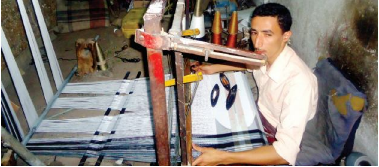
أصابع تعزف الألوان.. عيون تترقب الصدمة

العاملون في هذا المجال فضلا عن اتجاه بعض المعامل الجديدة صوب الخيوط الرديئة وهو ما يعني منتجات رديئة أيضا، حسب قوله .