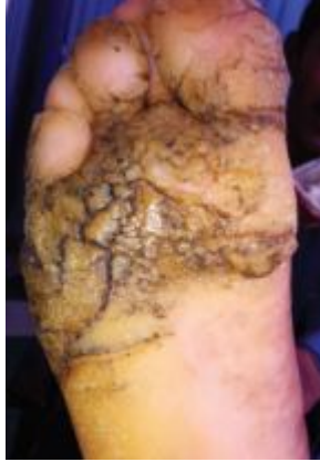
أثر الإصابة بالعدوى الجلدية

تفتقر الحكومة إلى إحصاءات حول عدد المصابين بأمراض جلدية معدية في أوساط السكان المقدر عددهم بأكثر من 23 مليون نسمة. لكن د. بلقيس جبارالله - استشارية أمراض جلدية - تقول إن 80% من المترددين على أحواض الوضوء في المساجد، مصابون بفطريات القدم.