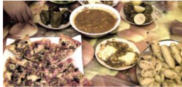
يقول الطبيب حمية .يقول الصائم عيامتني اتسعي

على مدى أكثر من خمسين عاماً لم تتمكن مناهج التربية والتعليم وبرامج التوعية التابعة لوزارة الصحة من تقديم خدمة معرفية جيدة في اتجاه تقنين الوجبات ..الأمر ذاته ينسحب على برامج وزارة الإعلام التي تفرغت وما تزال لبناء النافذين على حساب حاجة البلد لخطاب اعلامي