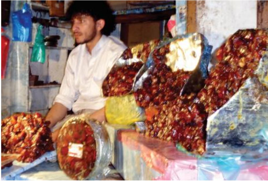
التمر.. سنة الاضطرار في الشهر الكريم

أيما وليت وجهك بامتداد العالم الاسلامي تجد أن شهر رمضان هو أفضل المواسم بيعاً للتمور بأنواعها المختلفة ذلك أن الصائمين يقتدون بالرسول الكريم صلى الله عليه وسلم ويفطرون بالتمر طوال أيام شهر الصيام غير أن ذلك لا يعني التوقف عن شراء التمر بعد رمضان لكنه قد يعني انخفاض منسوب الأقبال والبيع نسبياً في غير رمضان .