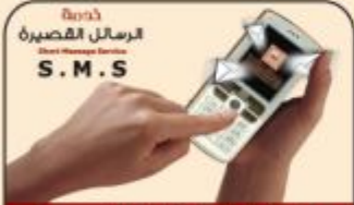
خدمة الرسائل القصيرة